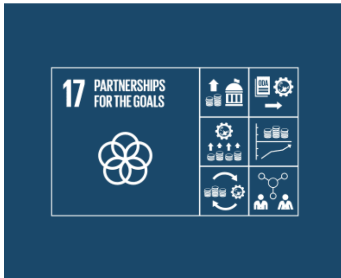
Gambar 2. SDGs Goal No. 17

pembangunan resmi dari negara-negara maju meningkat hingga 66 persen antara tahun 2000 sampai 2014, krisis kemanusiaan akibat konflik dan bencana alam terus menuntut bantuan dan sumber-sumber finansial. Banyak negara yang juga meminta bantuan pembangunan resmi untuk meningkatkan pertumbuhan dan perdagangan. Memperkuat solidaritas global adalah satu dari 17 Tujuan Global yang tersusun dalam SDGs 2030. Pendekatan terintegrasi dan kolaborasi sangat penting demi kemajuan di seluruh tujuan.